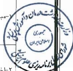
جدول ب- دروس پایه، اصلی و تخصصی برنامه آموزشی رشته بهورزی در مقطع کاردانی