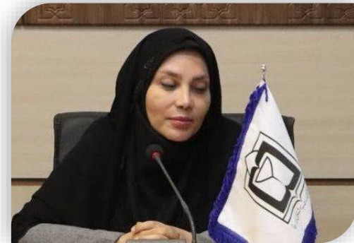
معاون بهداشت دانشکده علوم پزشکی تربت جام خبر داد

ابلاغ دستورالعمل تشدید نظارت بر عوامل محیطی مراسم اربعین و دهه آخر صفر ۱۴۰۳ به شبکه های بهداشت و درمان و مراکز خدمات جامع سلامت شهری و روستایی