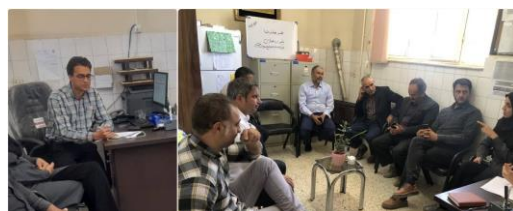
برگزاری کارگروه مشترک سلامت (مرکز خدمات جامع سلامت خیرآباد، اعضای شورا و دهیازان روستاهای خیرآباد، ابدال آباد، حسن آباد، سماخون، کلاته بزرگ، حسنک)