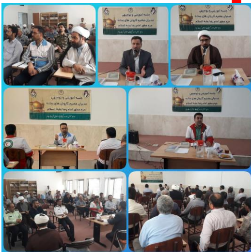
جلسه آموزشی و توجیهی مدیران کاروان های پیاده حرم مطهر امام رضا علیه السلام در محل سازمان تبلیغات اسلامی شهرستان تربت جام