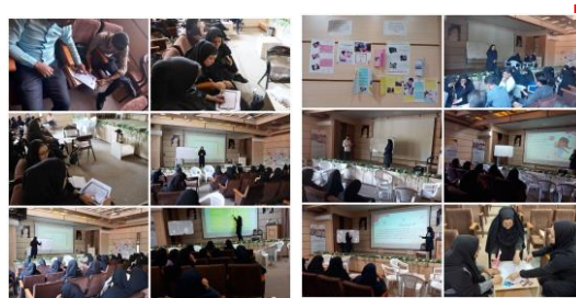
برگزاری کارگاه آموزش پیشگیری از مرگ کودکان به علت سوانح و حوادث