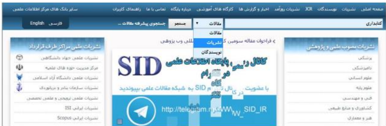
شکل ۵-۵: جستجو بر اساس نام نشریه در پایگاه SID

اگر جستجو بر اساس نام نشریه باشد، کلیه نشریاتی که واژه مورد نظر در عنوان آن باشد با مشخصات کامل نمایش داده می‌شود ضمن آنکه همانند بخش جستجوی مقالات، اطلاعات مربوط به دوره انتشار و گروه‌های تخصصی مرتبط با نشریات یافت شده قابل دسترسی می‌باشد که با انتخاب هریک از آنها نتایج بهتر و دقیق‌تری حاصل می‌شود. در نتایج این جستجو علاوه بر نشریات علمی پژوهشی مصوب کمیسیون نشریات وزارت علوم، تحقیقات و فناوری و وزارت بهداشت، درمان و آموزش پزشکی، نشریات علمی دانشگاه آزاد اسلامی، نشریات علمی دانشگاه پیام نور، نشریات جهاد دانشگاهی و نشریات علمی ترویجی و علمی تخصصی نیز قابل دسترسی می‌باشند.