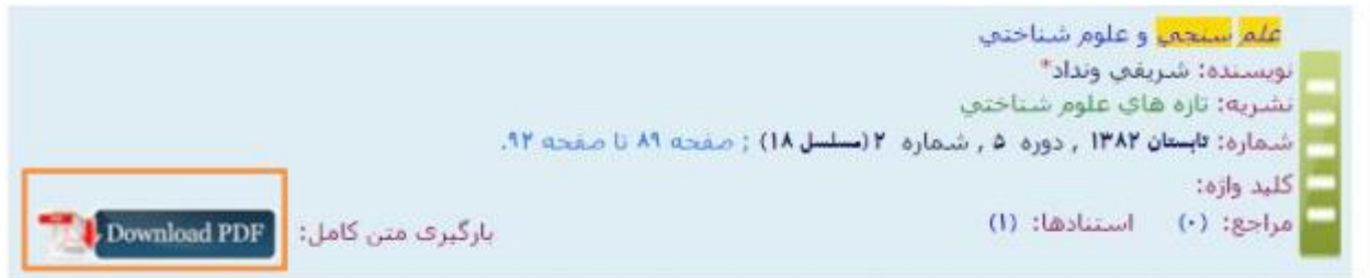
شکل ۴-۵: جستجو بر اساس نام مقالات در پایگاه SID

در صورتیکه متن کامل مقاله یافت شده در بانک اطلاعاتی موجود باشد، می‌توان با کلیک بر روی گزینه مربوطه به صورت مستقیم فایل را دریافت نمود.