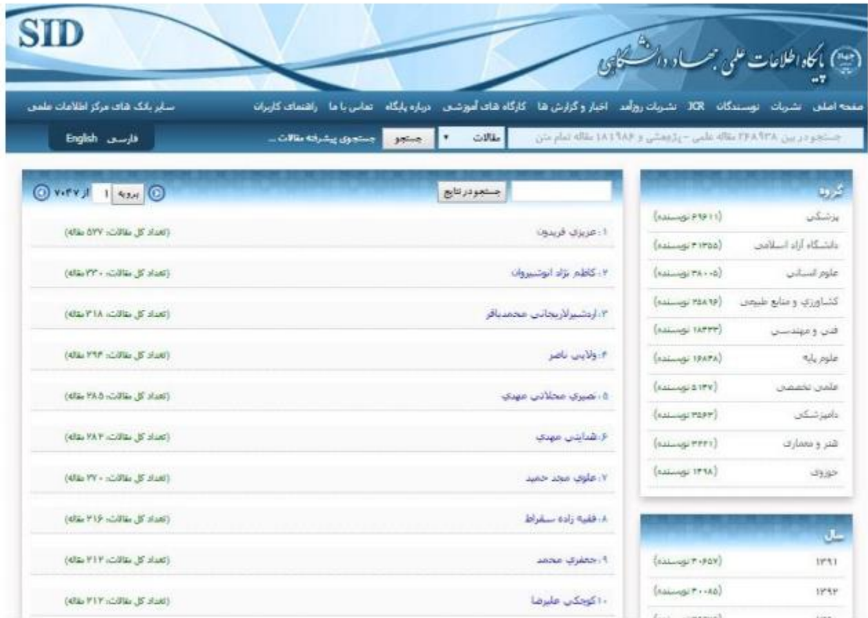
شکل ۵-۱۴: ده نویسنده برتر در پایگاه SID