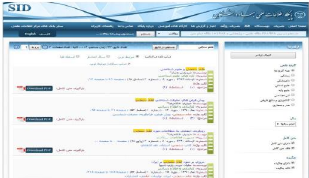
شکل ۳-۵: جستجو بر اساس نام مقالات در پایگاه SID

چنانچه جستجو برای یافتن مقالات باشد، در صفحه نتایج مقالاتی نمایش داده می‌شود که واژه وارد شده در بخشی از عنوان مقاله و یا کلیدواژه وجود داشته باشد.