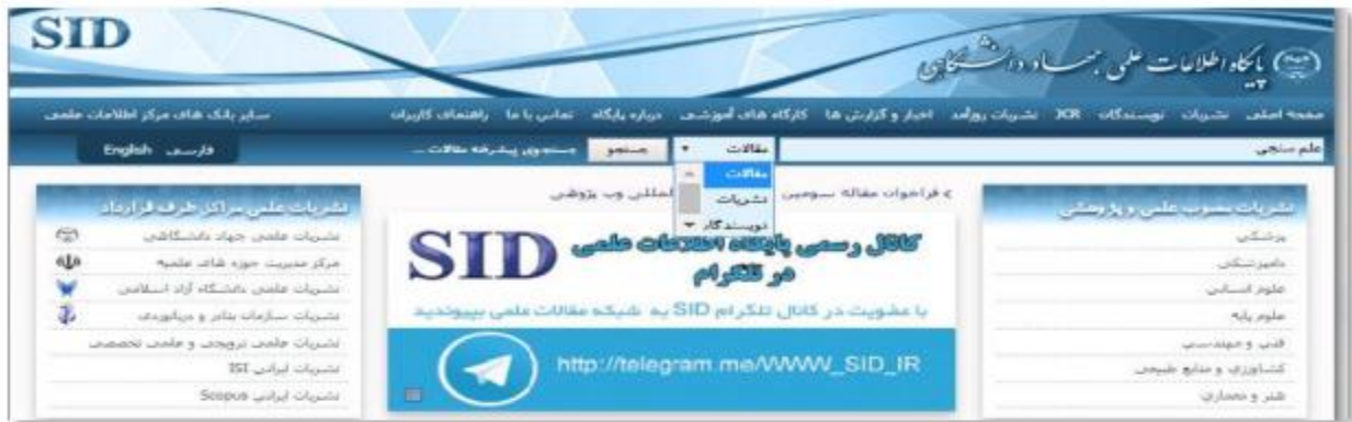
شکل ۲-۵: جستجوی ساده در پایگاه SID

در بخش جست و جوی ساده، کاربر کلید واژه مورد نظر را در کادر بزرگ بالای صفحه وارد نموده و نوع جستجوی خود را بر اساس مقاله، نام نویسنده و یا نام نشریه مشخص می نماید و با کلیک نمودن دکمه جستجو وارد صفحه نتایج می‌شود.